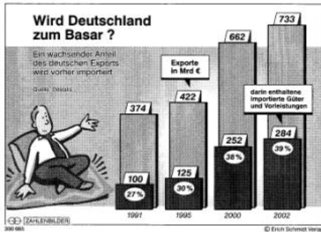
Schaubild Erich Schmidt Verlag, Deutschland als „Basar-Ökonomie?“ (Nr. 390 665, 8/04)