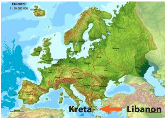
Der Sprung auf den neuen Kontinent, der den Namen der Entführten bekam

Viele Bilder von Europa auf dem Stier sind uns vertraut. Sie stammen vornehmlich aus dem griechischen Kulturraum und der römischen Herrschaft seit etwa dem 6. Jahrhundert vor Christi. Mit unserer heutigen Redeweise: „Europa sitzt auf dem Stier“ sind wir von der relativ späten Überlieferungsgeschichte des römischen Dichters Ovid (43 v. Chr. - 18 n. Chr.) beeinflusst. In seinen Metamorphosen erzählt er, wie der liebestolle Gottvater Zeus sich in einen Stier verwandelte, um die schöne Königstochter namens Europa für sich zu gewinnen.